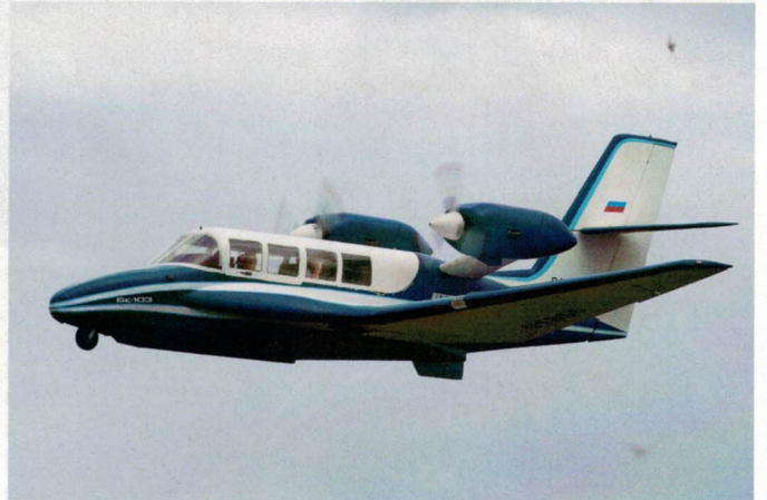
Ce bimoteur électrique est rare Beriev BE 103: un sujet original.