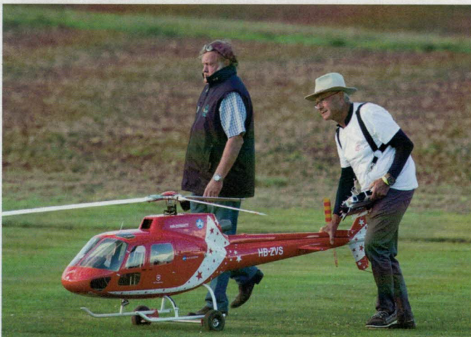
Cet Écureuil issu d'un kit Vario était présent le samedi.