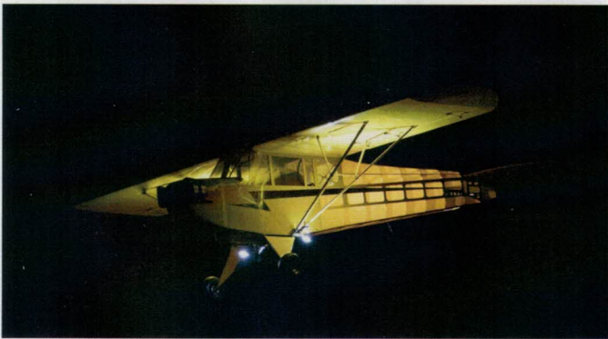
Pour les vols de nuit, le public a pu notamment assister aux démonstrations de cet énorme Piper J3.